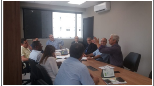
12/03/19 - Reunião do Colegiado Diretor do SINDALEMG, na sede do sindicato, com o objetivo debater o planejamento de atividades do sindicato.