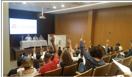
05/04/19 - Assembleia Geral Extraordinária, para a formulação da pauta de reivindicações apresentadas pelos servidores durante a campanha "Pauta Participativa 2019".