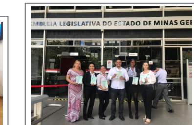
12/03/20 - Ação conjunta entre o SINDALEMG, ASLEMG, representantes dos servidores efetivos, e os representantes dos servidores de recrutamento amplo, para divulgar a campanha TODOS JUNTOS CONTRA O ASSÉDIO, durante a SEMANA ESTADUAL DE CONSCIENTIZAÇÃO, PREVENÇÃO E COMBATE À PRÁTICA DE ASSÉDIO MORAL.