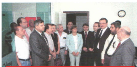
Inauguração da primeira sede do Sindalemg (20/08/2008)